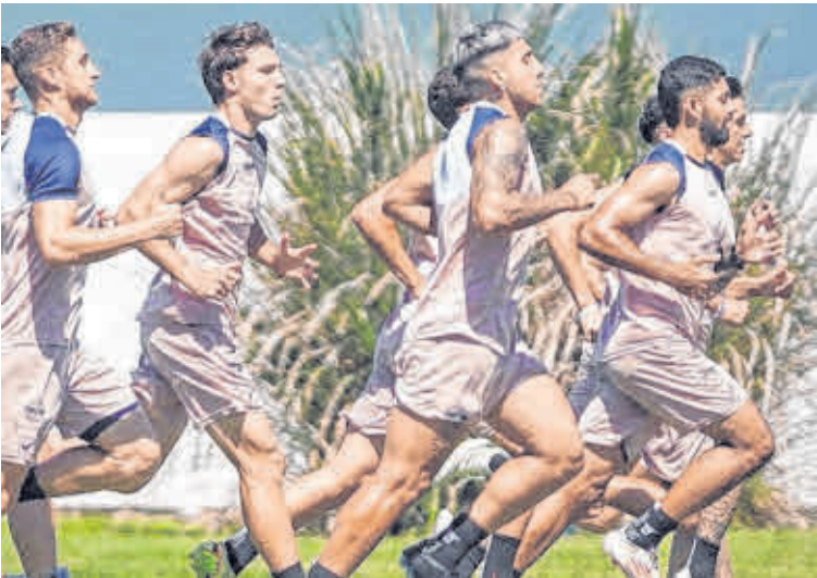
GINNASIA REGRESA HOY POR LA MAÑANA A LOS ENTRENAMIENTOS